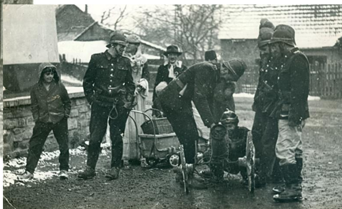
Hruškův zbouraný dům