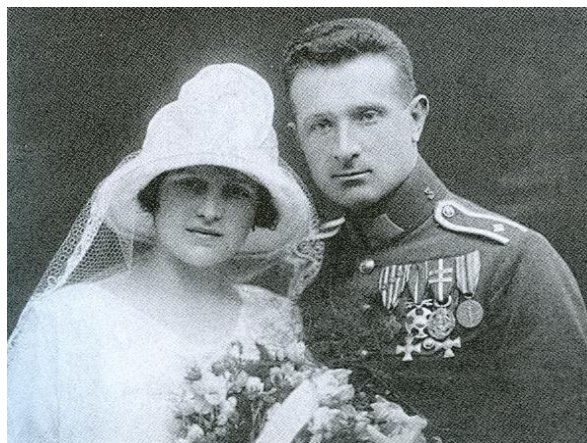
Svatební fotografie Ireny Stratilové a Ludvíka Svobody

do Prahy, kde Ludvík Svoboda vykonával funkci ministra obrany a Irena se zapojila do práce Červeného kříže. Během čistek v 50. letech byl z této funkce odvolán a odešel z politiky. Do ní se vrátil v roce 1968, kdy byl zvolen prezidentem republiky . Jeho žena v roli první dámy podpořila myšlenku SOS vesniček . Manželé také zpřístupnili zahradu v Lánech, nechali zbořit zeď mezi Belvederem a Královskou zahradou. Ludvík Svoboda zemřel 20. září 1979, jeho žena Irena 17. července 1980. Oba jsou pochováni v rodinné hrobce v Kroměříži