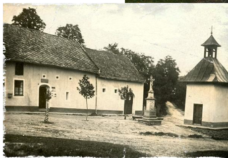
Chlouba obce - cvrčovická zvonice v současné době a v minulosti.

Obec Cvrčovice se nachází 14 km jihovýchodně od Kroměříže na úpatí Chřibů. Obcí protéká potok zvaný Cvrčovický. Cvrčovice jsou místní částí Zdounek. V současné době zde žije 159 obyvatel.